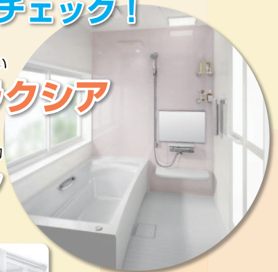
バスルームイメージ