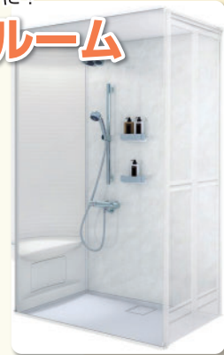
シャワールームイメージ