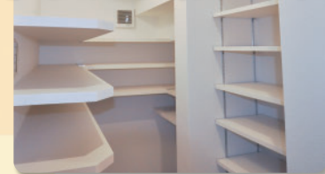
トランクルームイメージ